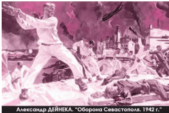
Александр ДЕЙНЕКА. «Оборона Севастополя. 1942 г.»

- ты не вправе не заявить протест в связи с тем, что кровавые события в Украине являются